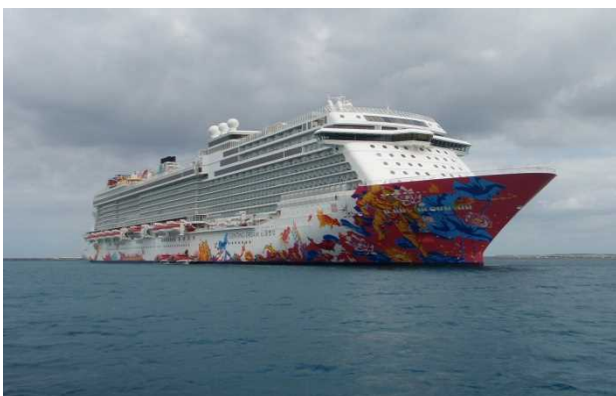
4月5日 平良港に沖泊するゲンティン・ドリーム号