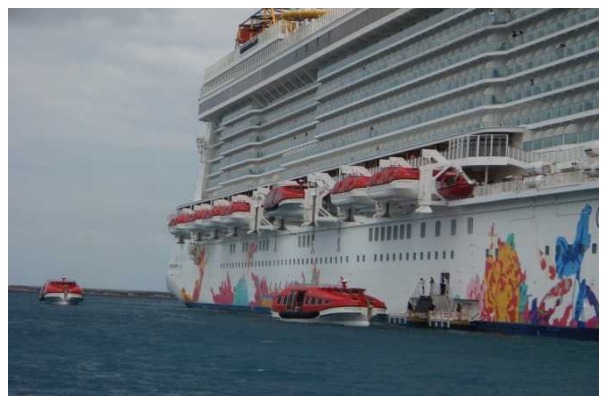
テンダーボートで宮古島に向かう様子