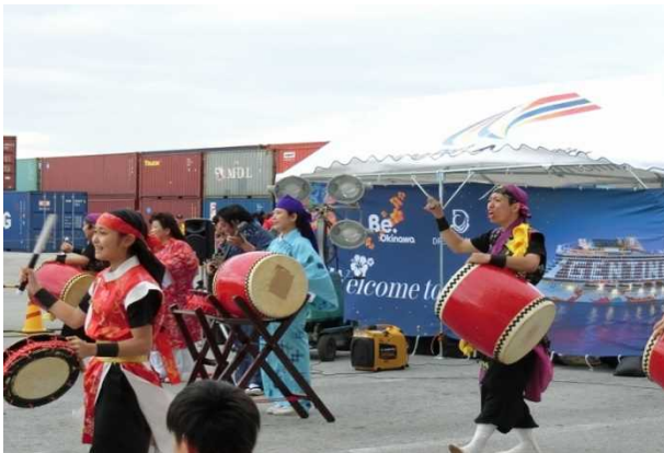
4月4日 那覇港における歓迎の様子