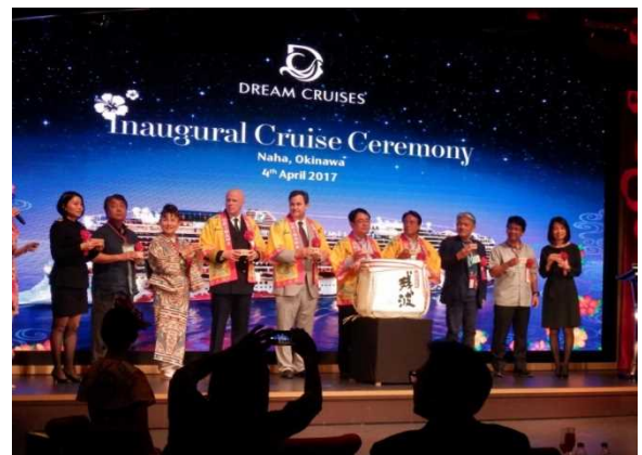
初寄港を祝って鏡開きをする様子