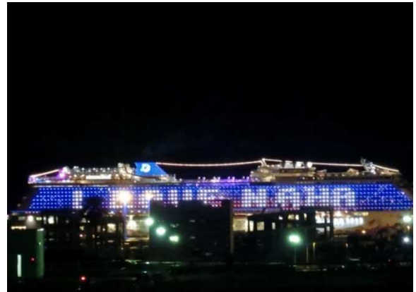
「I LOVE NAHA」と光輝くゲンティン・ドリーム号