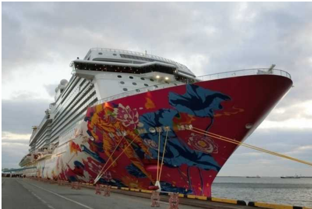
4月4日 那覇港に初寄港したゲンティン・ドリーム号

ゲンティン・ドリーム号は「ドリーム・クルーズ社」が所有し、2016年11月に初就航した新造船です。