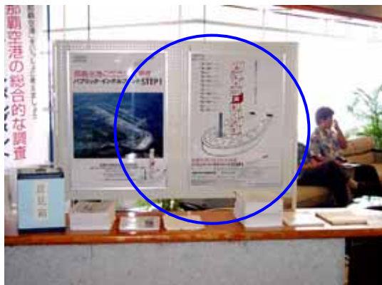
ポスター掲載の様子