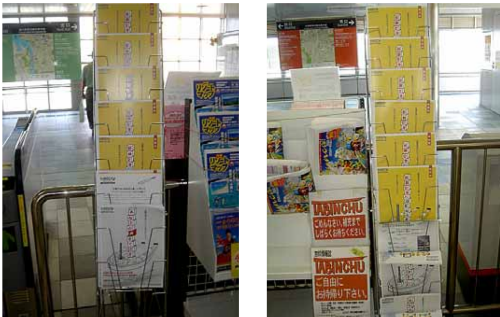
モノレール駅での配布ラックの様子