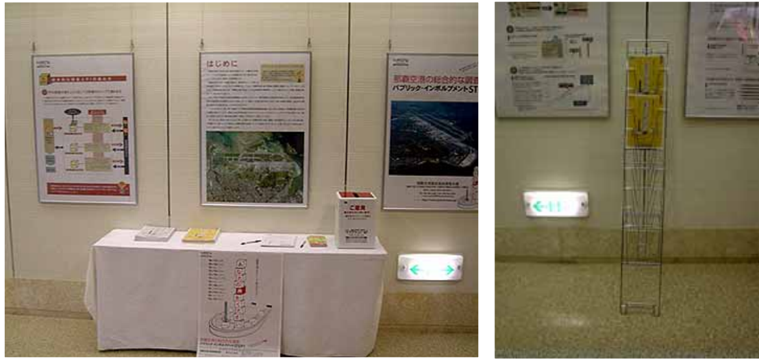
那覇空港ギャラリーでのポスター掲示、配布ラックの様子