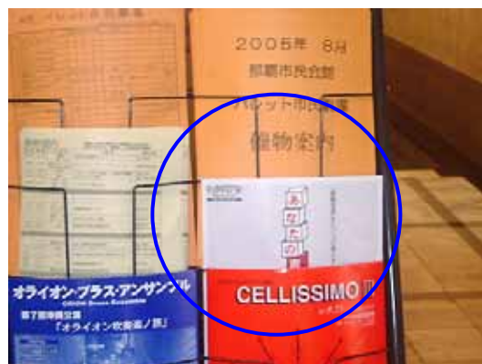
チラシ設置の様子