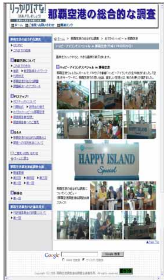
「おでかけHappy-in 那覇空港」の様子