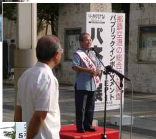
PI開始式の挨拶（牧野副知事）