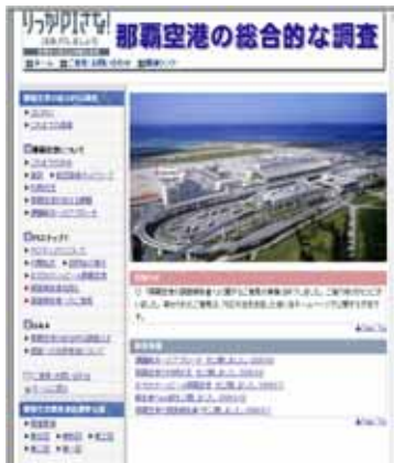
「那覇空港の総合的な調査」HPトップ