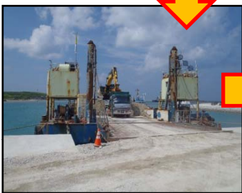
埋立現場へ到着～ダンプトラックへ積込