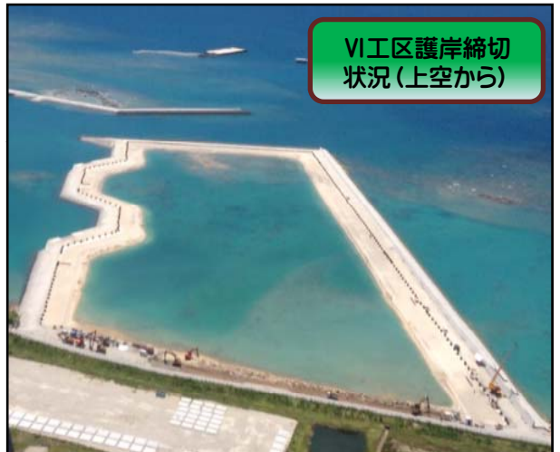
VI工区護岸締切状況(上空から)