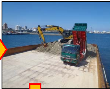
土砂運搬船へ積込