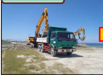
土取り場所で土砂積込