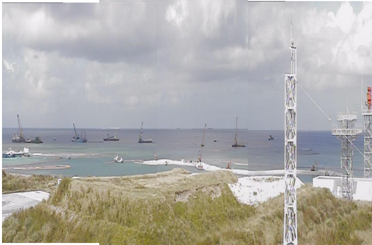
④ 平成26年10月 護岸築造工事