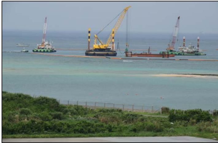
③-A 平成26年8月 仮設棧橋(2)築造工事