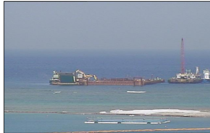
③-A 平成26年9月 仮設棧橋(2)築造工事