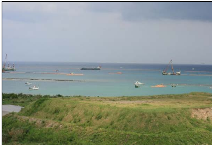
③-B 平成26年8月 浚渫工事・護岸築造工事