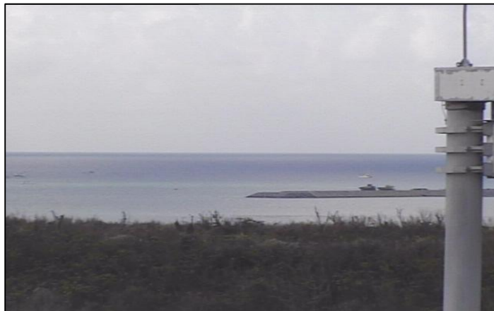
② 平成26年10月 仮設棧橋(1)築造工事