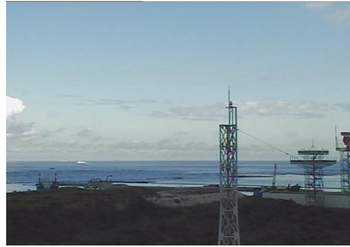
④ 平成26年9月 護岸築造工事