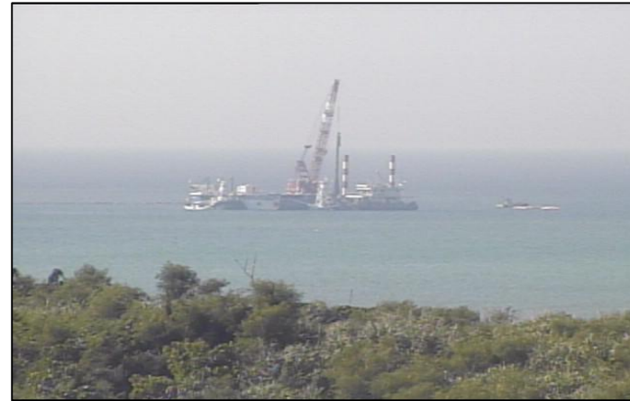
① 平成26年9月 浚渫工事