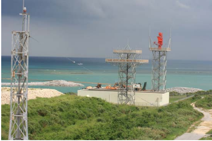
④ 平成26年8月 護岸築造工事