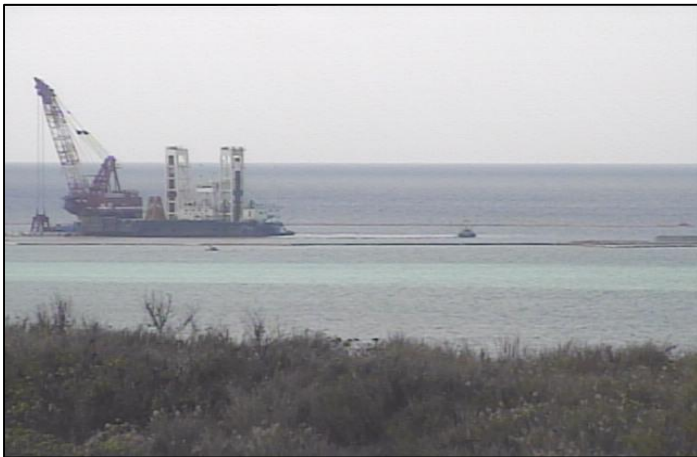
① 平成26年10月 浚渫工事