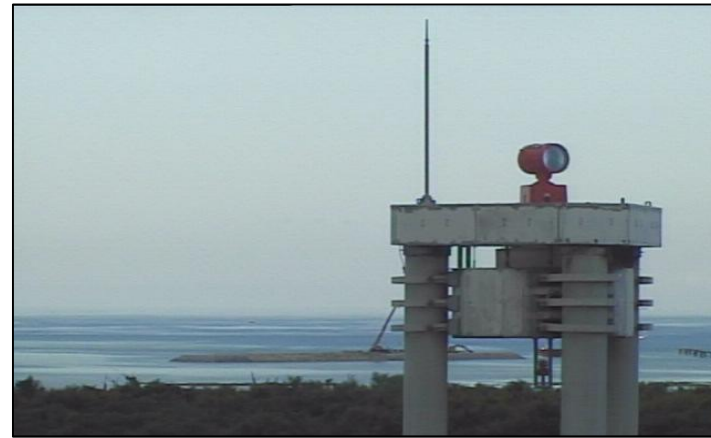
② 平成26年9月 仮設棧橋(1)築造工事