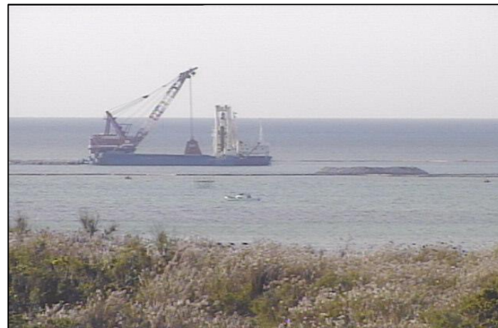
① 平成26年11月 護岸築造工事