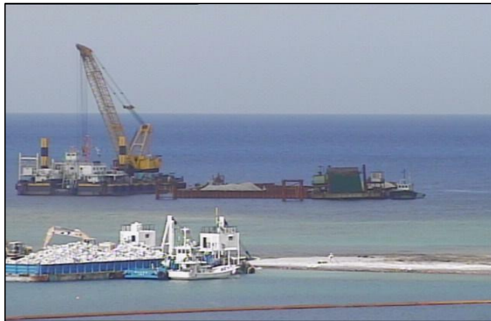
③-A 平成26年10月 仮設棧橋(2)築造工事