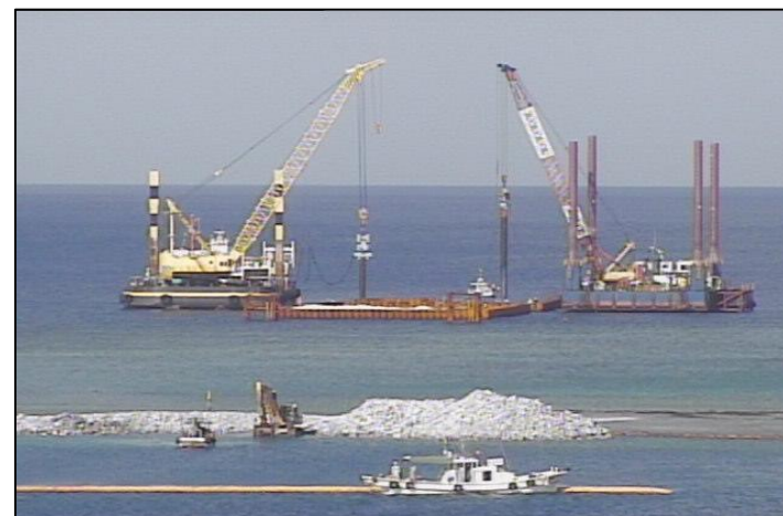
③-A 平成26年11月 仮設棧橋(2)築造工事