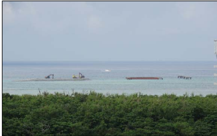
② 平成26年8月 仮設棧橋(1)築造工事