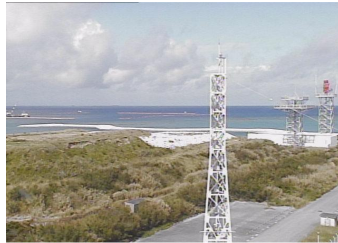
④ 平成26年11月 護岸築造工事