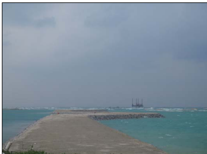
④ 平成26年11月 護岸築造工事