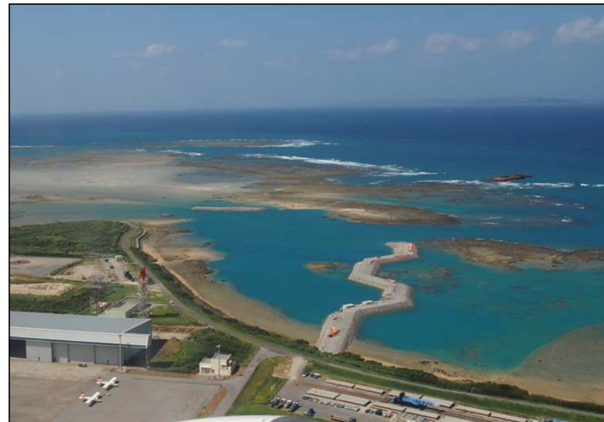
④ 平成26年10月 護岸築造工事(上空から)