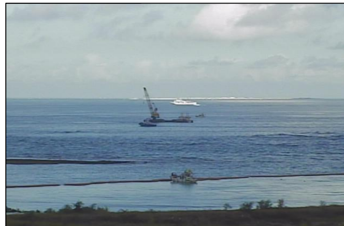
③-B 平成26年9月 浚渫工事・護岸築造工事