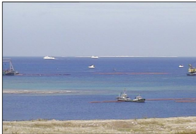
③-B 平成26年10月 浚渫工事・護岸築造工事