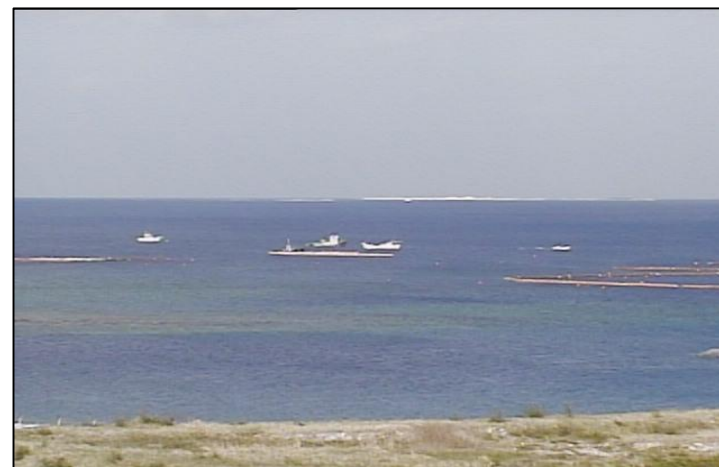
③-B 平成26年11月 浚渫工事・護岸築造工事