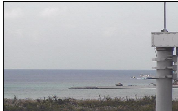
② 平成26年11月 仮設棧橋(1)築造工事