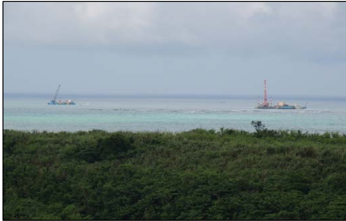
① 平成26年8月 浚渫工事