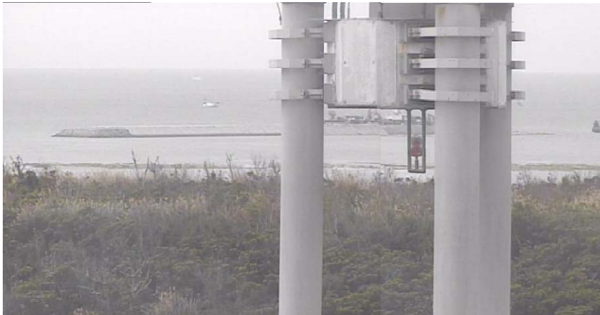
② 平成27年1月 仮設棧橋(1)築造工事