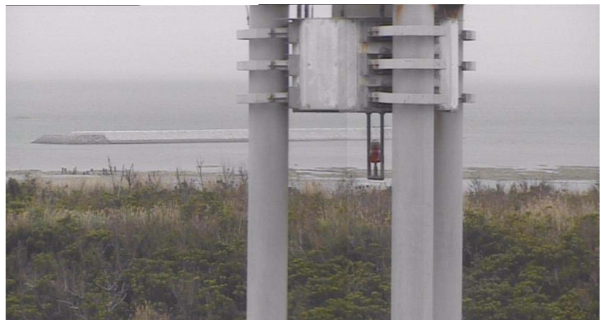
② 平成27年2月 仮設棧橋(1)築造工事