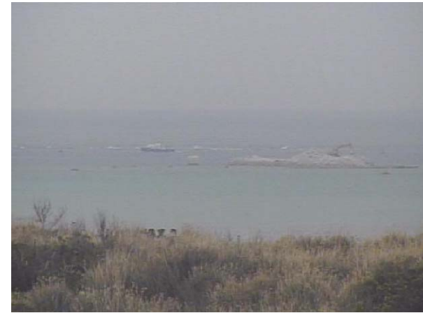
① 平成27年2月 護岸築造工事