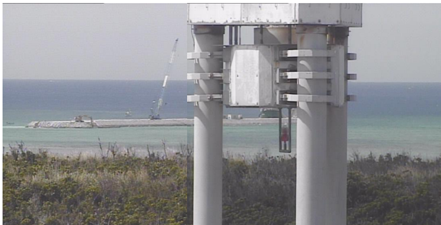
② 平成27年3月 仮設棧橋(1)築造工事 護岸築造工事