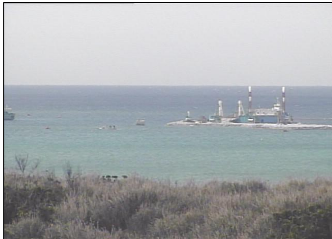
① 平成27年3月 護岸築造工事