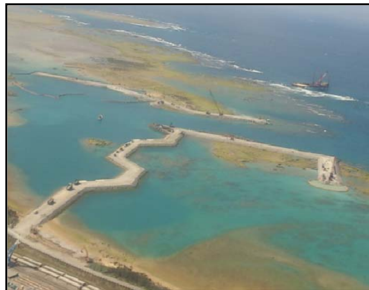
④ 平成27年2月 護岸築造工事(上空から)