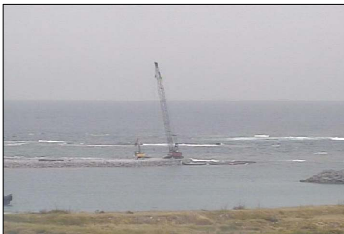
③-B 平成27年1月 護岸築造工事