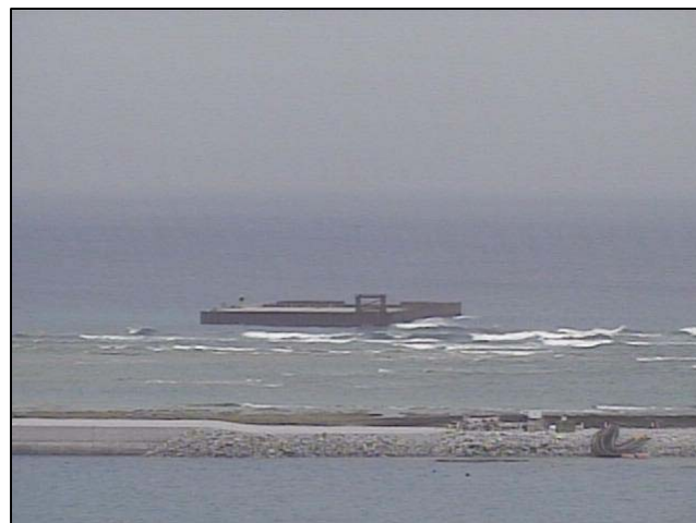
③-A 平成27年2月 仮設棧橋(2)築造工事