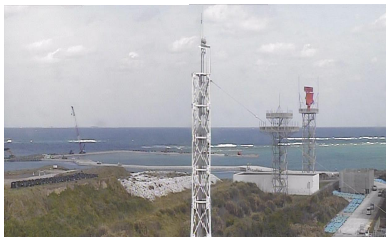
④ 平成27年3月 護岸築造工事