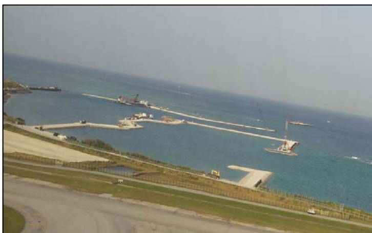
④ 平成27年3月 護岸築造工事(上空から)