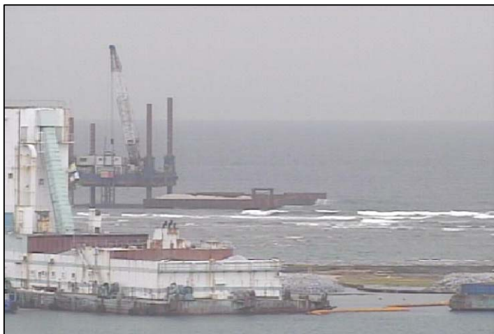
③-A 平成27年1月 仮設棧橋(2)築造工事