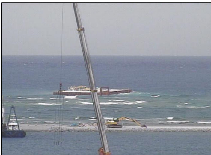
③-A 平成27年3月 仮設棧橋(2)築造工事