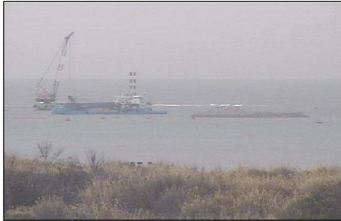
① 平成27年1月 護岸築造工事