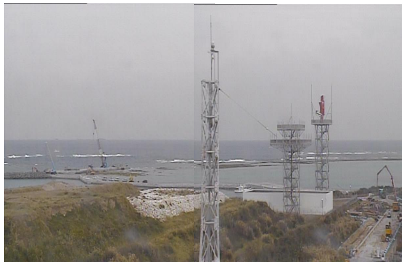
④ 平成27年1月 護岸築造工事