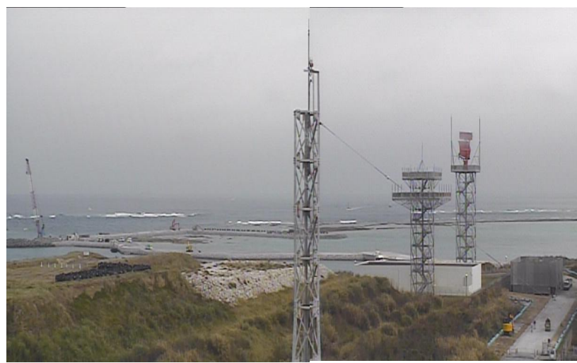
④ 平成27年2月 護岸築造工事