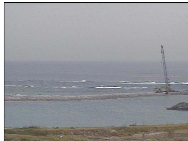
③-B 平成27年2月 護岸築造工事