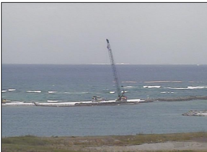
③-B 平成27年3月 護岸築造工事