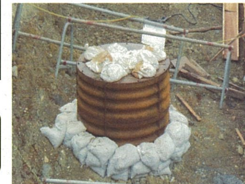
小型ライナープレート設置状況