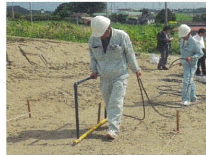
磁気探査研修実施状況 (実地)