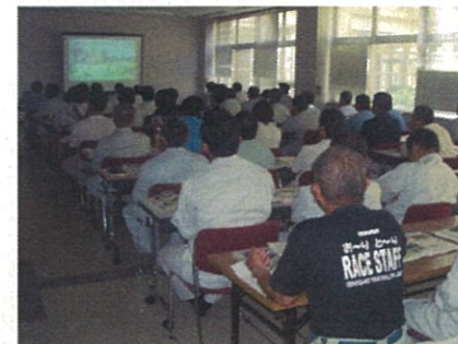
磁気探査研修実施状況 (座学)

※本年度は4回(7月:那覇市、9月:名護市、11月:宮古島市、2月:那覇市)実施予定。