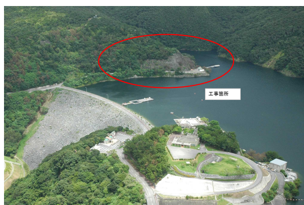
右岸進入路法面補修工事(福地ダム)