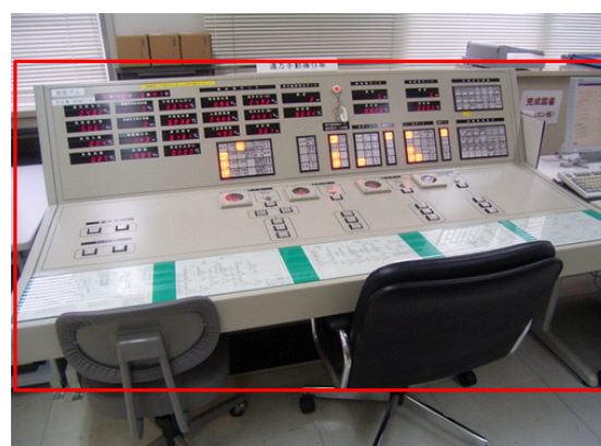
ダム管理用制御処理設備更新(漢那ダム)