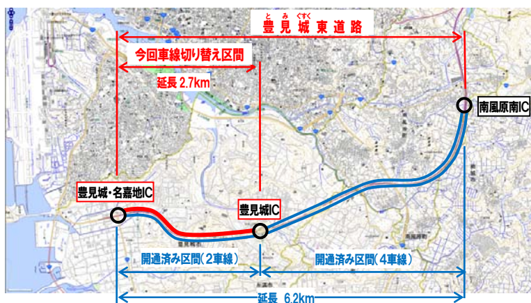
整備状況図 (豊見城市上田付近)