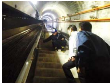
現地確認検査(ダム堤体)