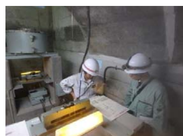
現地確認検査(計測機器)