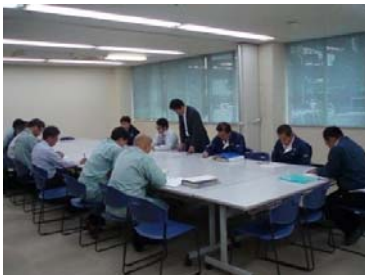
定期検査全体講評

今年度は平成28年10月に安波ダム、平成29年1月に漢那、羽地ダムで定期検査が実施されました。検査の中で検査官から指摘された事項については確実に対応し、ダムの機能が十分発揮できるよう、今後も適正なダム管理に努めてまいります。