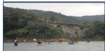
カヌー体験の状況(羽地ダム)