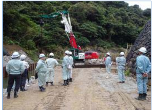
銅矢板引抜作業に対する安全施工の確認 (大保ダム)

北部ダム統合管理事務所では、「工事安全点検」等の取り組みを通して工事の安全施工に対する意識の向上を図り、「建設事故災害ゼロ」に努めてまいります。