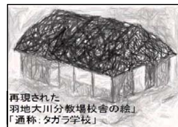
再現された 羽地大川分教場校舎の絵 「通称:タガラ学校」

羽地ダム管理支所では、今後、羽地地域の歴史を紹介する資料として資料館で展示するとともに、ダムツーリズムでも活用してまいります。