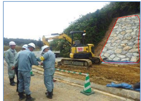
法面復旧作業に対する安全施工の確認 (金武ダム)