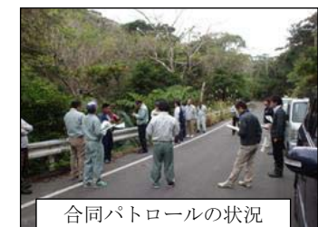
合同パトロールの状況

また、会議では不法投棄防止啓発活動や不法投棄の現状等についての報告があり、引き続き、不法投棄の防止に向けた活動を行っていくこと不法投棄抑止効果を高める監視カメラや不法投棄看板の設置場所等について調整・協力していく事などを確認しました。