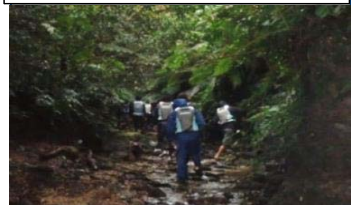
滝登りの状況(羽地ダム)

カヌー体験には、自治体の観光協会、カヌー体験事業者等15名が参加され、カヌー乗り場からダム湖上流に向かって移動した後、上流河川での清流トレッキングでは、案内者の誘導によりダム湖及び河川沿いに生息する動植物の観察などを行いました。参加者からは「カヤックでしか行けない特別感、冒険感が良かった!」「カヤックやSUP(スタンドアップパドルボード)のイベントも良いのでは?」等の意見・感想がありました。