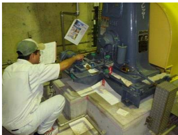
点検(ダム機械設備)