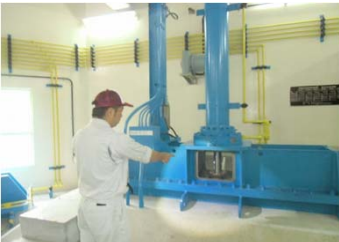
点検 (ダム機械設備)