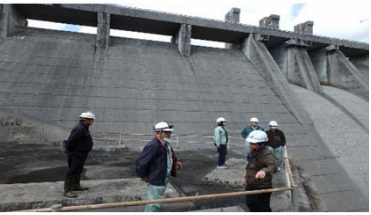
現地確認検査 (ダム堤体)