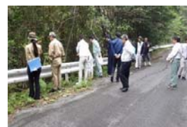
合同パトロールの状況