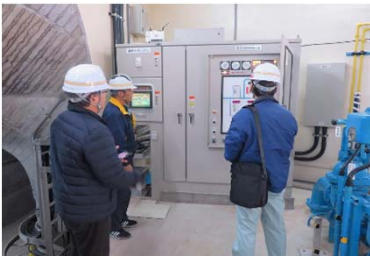
現地確認検査 (機械設備)