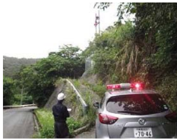
サイレン吹鳴確認状況