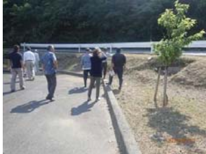
点検状況（羽地ダム）