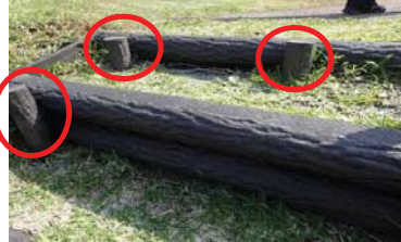
つまづきの原因（羽地ダム）