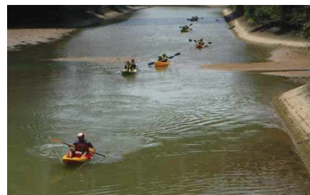
漢那福地川でカヤック体験

平成28年1月に重点「道の駅」に選定され、同年8月より「宜野座村観光拠点施設」として整備が進められていた「道の駅 ぎのざ」が平成30年4月28日(土)にリニューアルオープンしました。4月28日～5月6日は道の駅「ぎのざ」フェスティバルとして様々なイベントが行われています。漢那福地川では、カヤック体験と漢那ダム堤体内見学ツアーを行い好評でした。