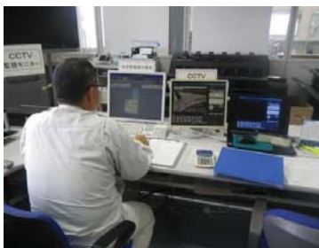
放流警報設備の操作状況