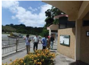
点検状況（安波ダム）