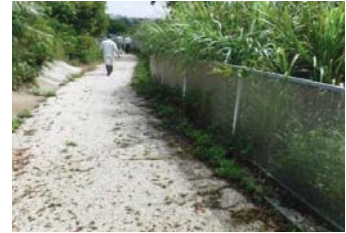
草刈りが必要（金武ダム）