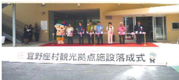
落成式典(テープカット)