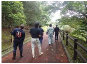
点検状況（福地ダム）