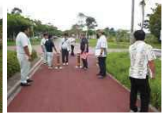
点検状況（漢那ダム）