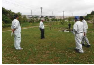
点検状況（金武ダム）