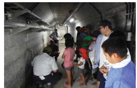
漢那ダム堤体内を見学