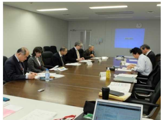
水文観測検討会の開催状況

今回の検討会による指導・助言も踏まえて、今後も、河川の適正な維持、河川環境の整備及び保全、その他の河川の管理に必要な水文統計資料の整理・蓄積を図り、観測が適切に行われるよう努めていきたいと考えています。