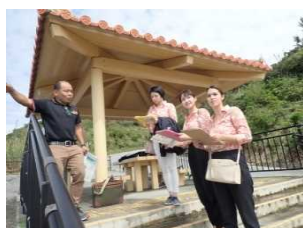
大保ダム概要説明 (大保ダム右岸展望台)