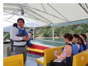
東村によるダムツーリズム説明 (福地ダム 自然観察船)