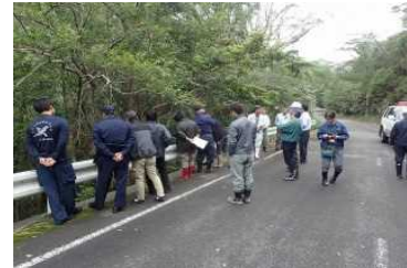
合同パトロールの状況