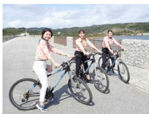
サイクリング体験 (大保ダム脇ダム堤頂道路)