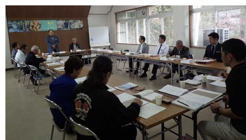
大保ダム水源地域ビジョン