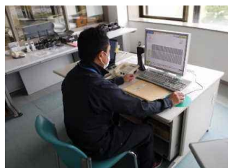
放流警報設備の操作状況