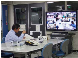
テレビ会議実施状況 (事務所～各支所)

今回は、新型コロナウイルス感染症対策として、事務所と各ダム管理支所との会議はテレビ会議システムを活用し、各ダム管理支所で行う会議では、3「密」対策として、必要最低限度の人数に絞り、窓の開放、離れて着席、マスク着用を徹底して行いました。