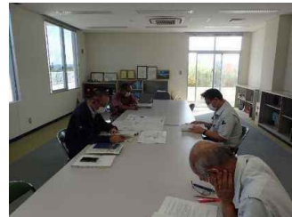
会議実施状況 (大保ダム管理支所)