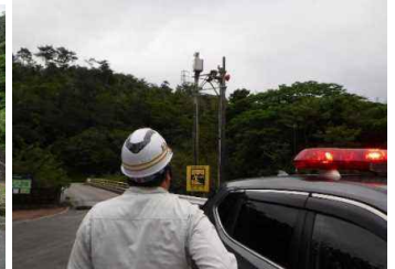
サイレン吹鳴確認状況