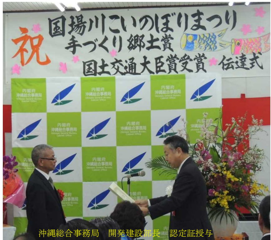
沖縄総合事務局 開発建設部長 認定証授与