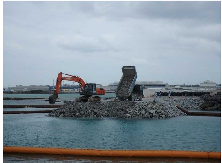
② 【V工区】平成29年11月撮影