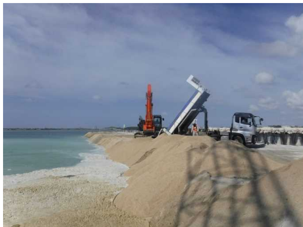
① 【I工区】海砂投入状況 (平成29年10月撮影)