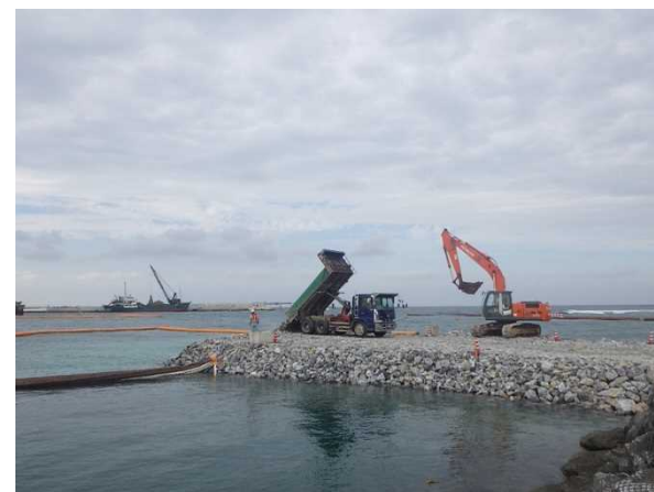
③ 【V工区】捨石投入状況 (平成29年11月撮影)