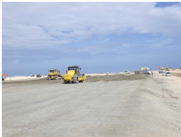
② 【II工区】改質土敷均し状況 (平成29年11月撮影)