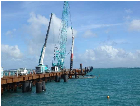
① 南側進入灯工事 杭打設状況 (平成29年8月撮影)