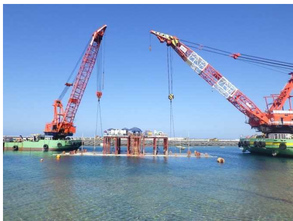
① 【V工区】通水カルバート据付状況 (平成29年8月撮影)