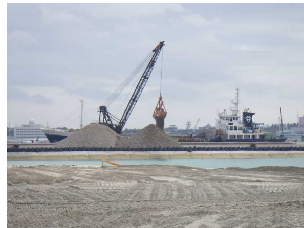
③ 【IV工区】海砂揚土状況 (平成29年11月撮影)