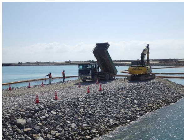
② 【V工区】捨石投入状況 (平成29年9月撮影)