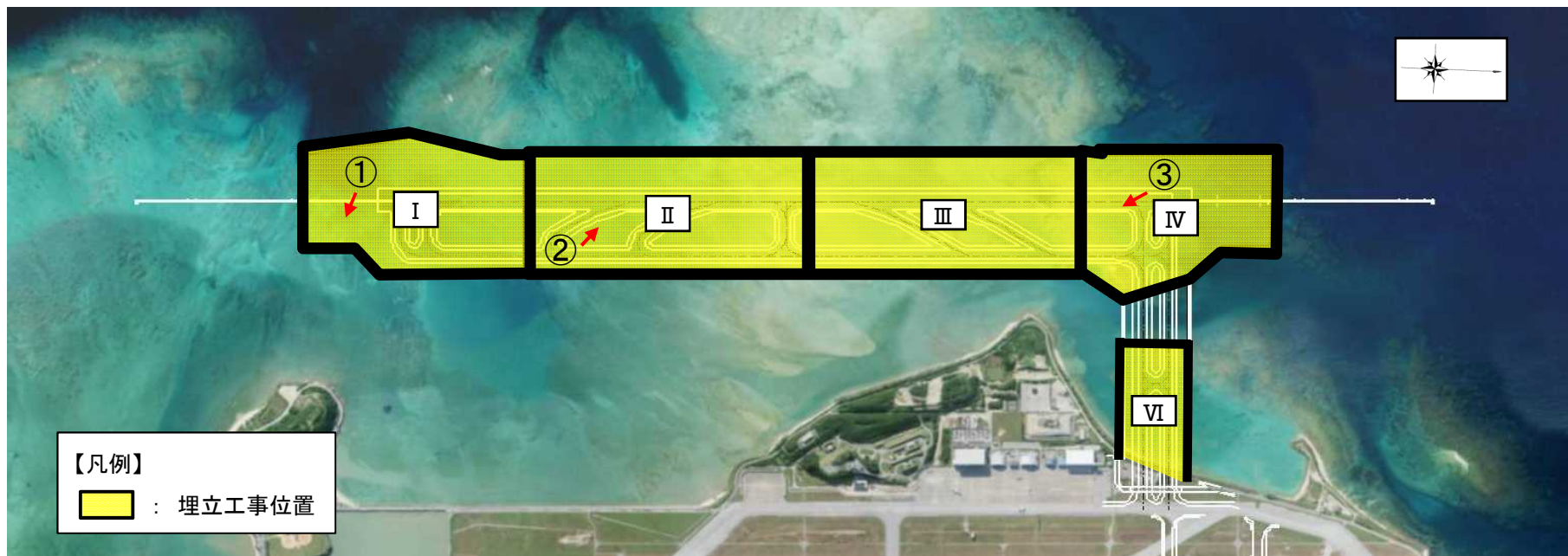
埋立工事の実施位置図