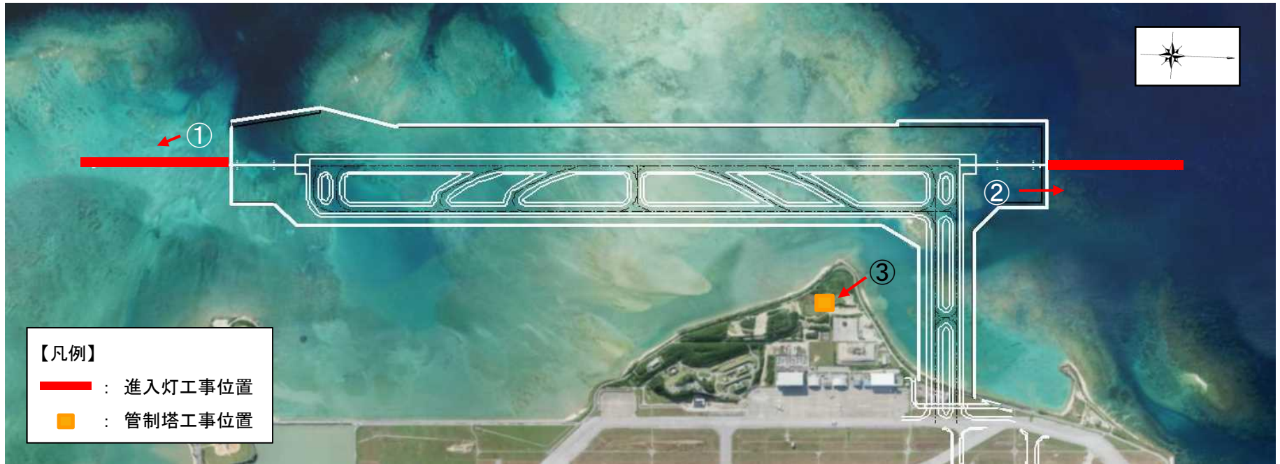
その他空港施設工事の実施位置図