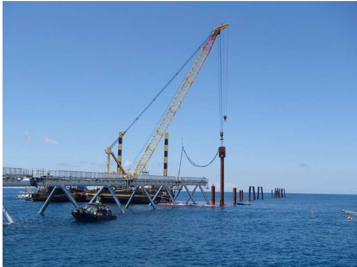
① 【北側進入灯】平成29年8月撮影