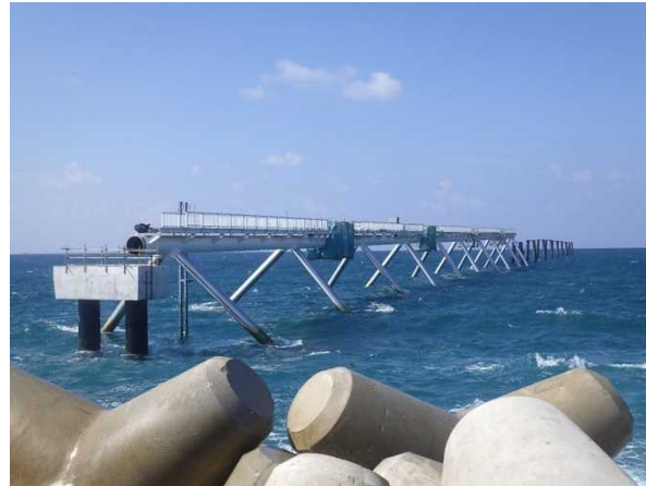
② 北側進入灯工事 現場全景 (平成29年10月撮影)