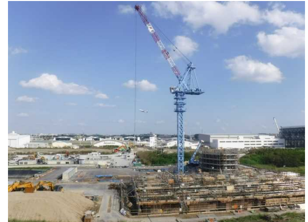
③ 管制塔工事 施工状況 (平成29年12月撮影)