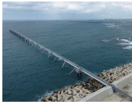
② 北側進入灯 完成状況 (令和元年9月撮影)