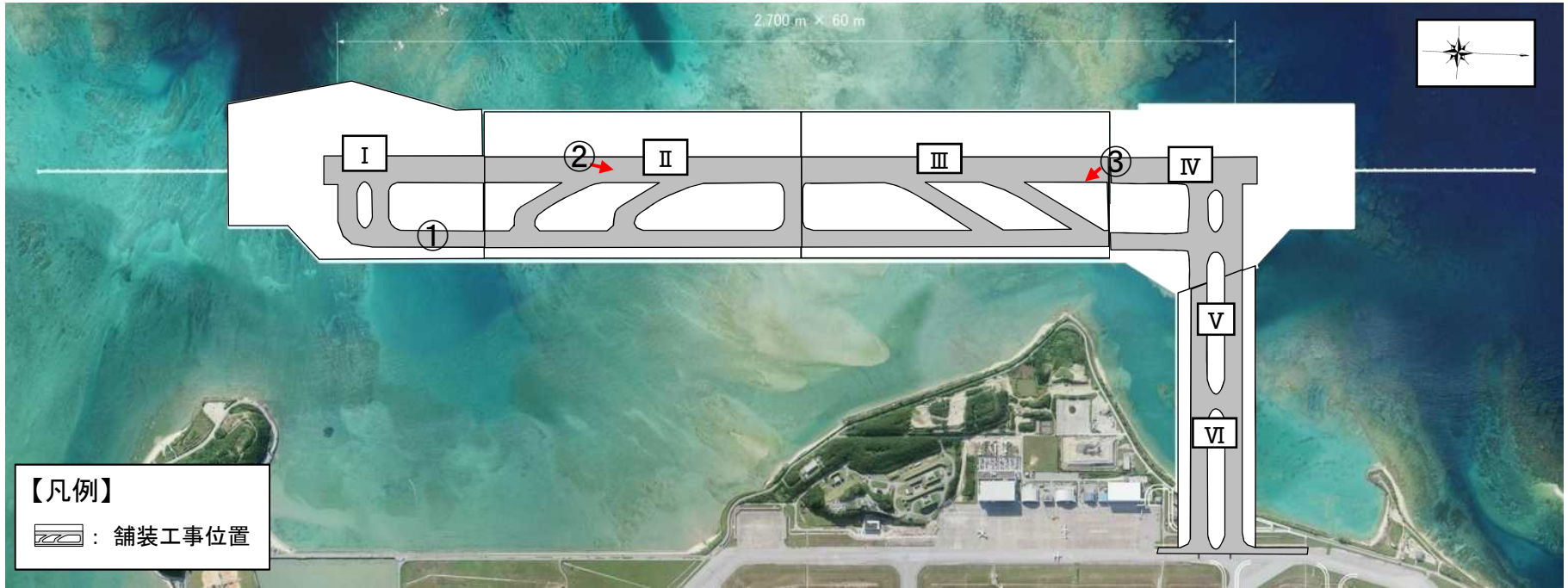
舗装工事の実施位置図