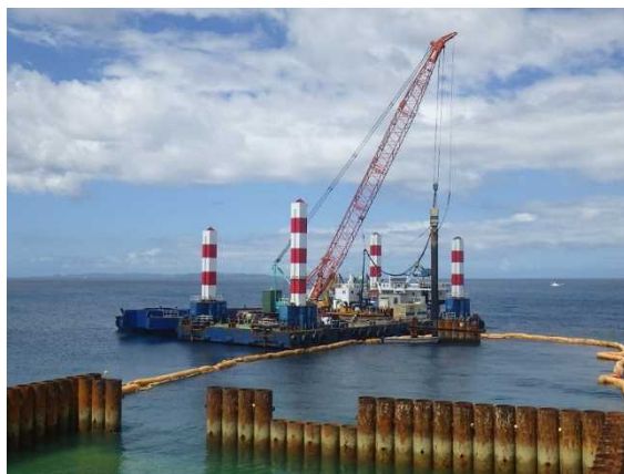
② 【仮設棧橋2撤去】鋼管矢板引抜状況 (令和元年9月撮影)