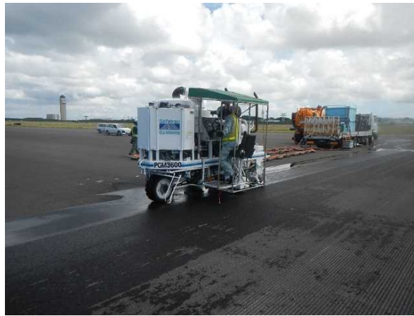
② 【Ⅱ工区】滑走路 グルーピング切削状況 (令和元年9月撮影)