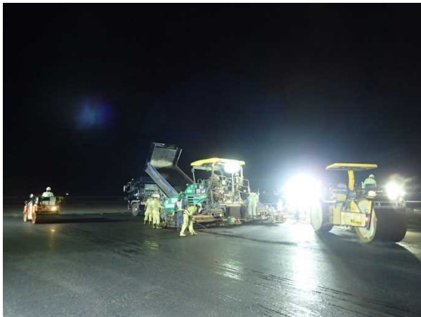
① 【Ⅰ工区】平行誘導路 表層敷設状況 (令和元年10月撮影)