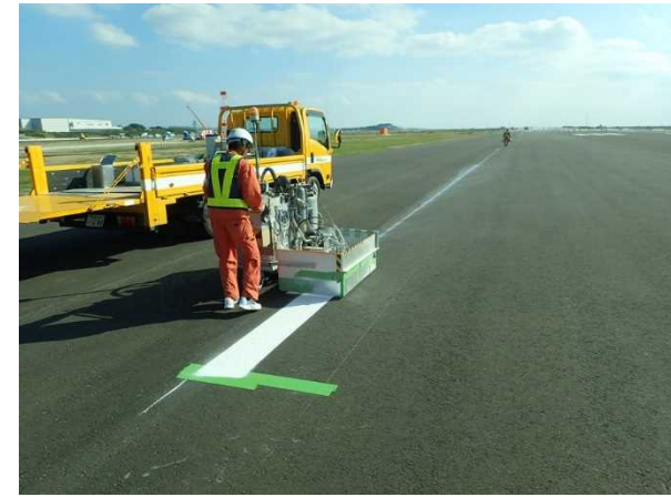
③ 【Ⅲ工区】滑走路 標識設置状況 (令和元年11月撮影)