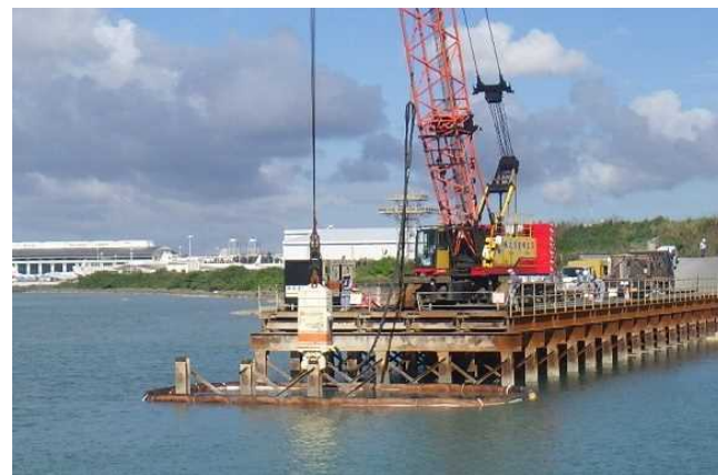
③ 【仮設橋撤去】H鋼杭引抜作業 (令和元年10月撮影)