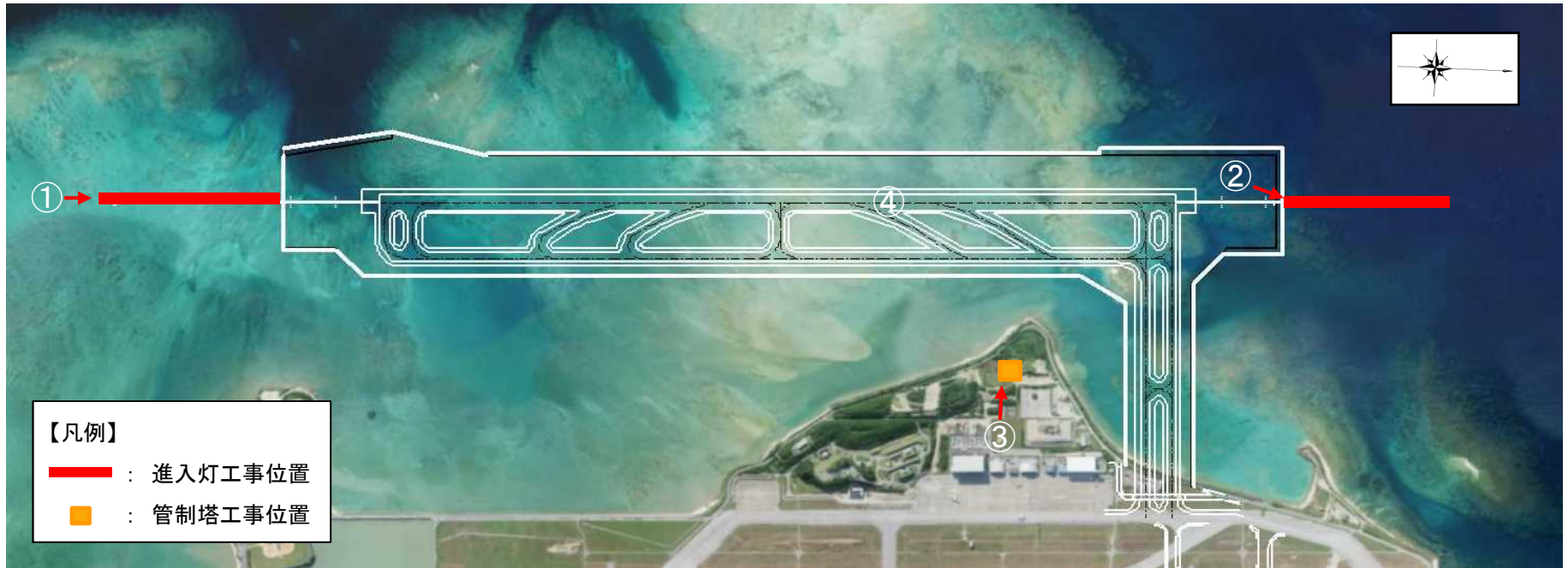
その他空港施設工事等の実施位置図