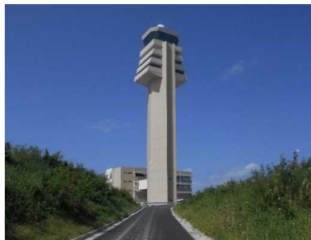
③ 管制塔 完成状況 (令和元年11月撮影)