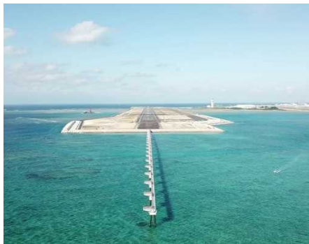
① 南側進入灯 完成状況 (令和元年11月撮影)