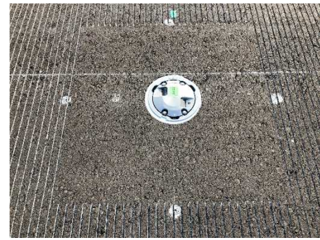
④ 滑走路中心線灯 設置状況 (令和元年10月撮影)