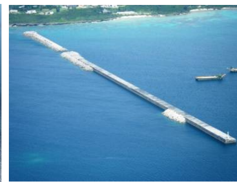
平成27年6月 整備状況