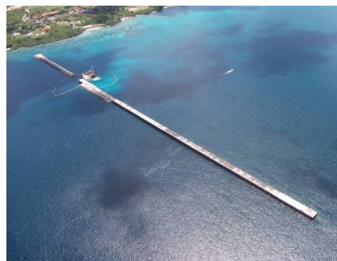
平成24年8月 整備状況