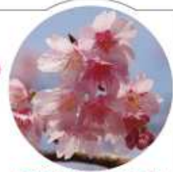
寒緋桜(カンヒザクラ)

※混雑区間は、民間プローブデータ(注1)(昨年度の桜まつり期間中の週末(金土日:8日))の時間帯別平均旅行速度から混雑区間(20km/h未満の区間)を予測したものです。 ※混雑区間は、過去の実績から予測しており、事故や気象状況等で変化することがありますので、1つの目安として活用下さい。 注1...専用機器(GPS)を搭載した車両から得られる緯度・経度、時刻等の情報