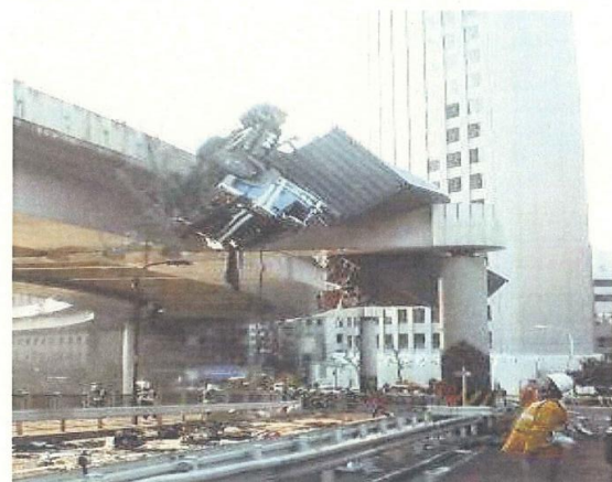
高欄を超え横転し、橋脚の横梁上に車両が落下。