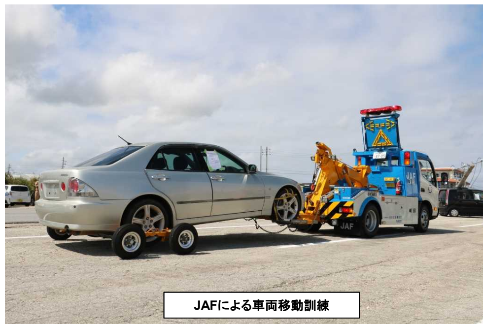
JAFによる車両移動訓練