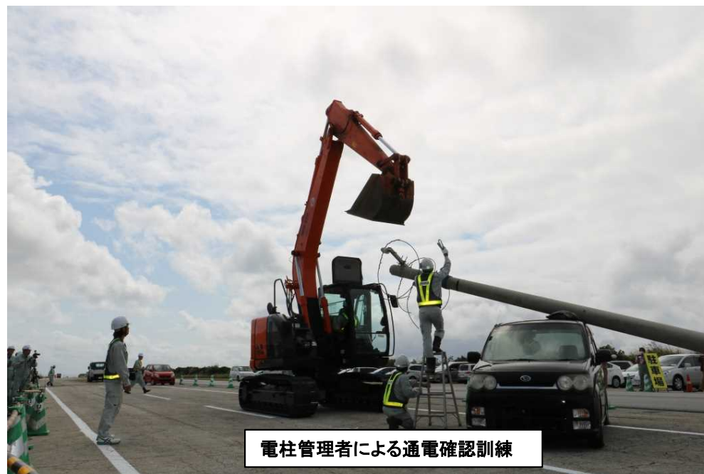
電柱管理者による通電確認訓練