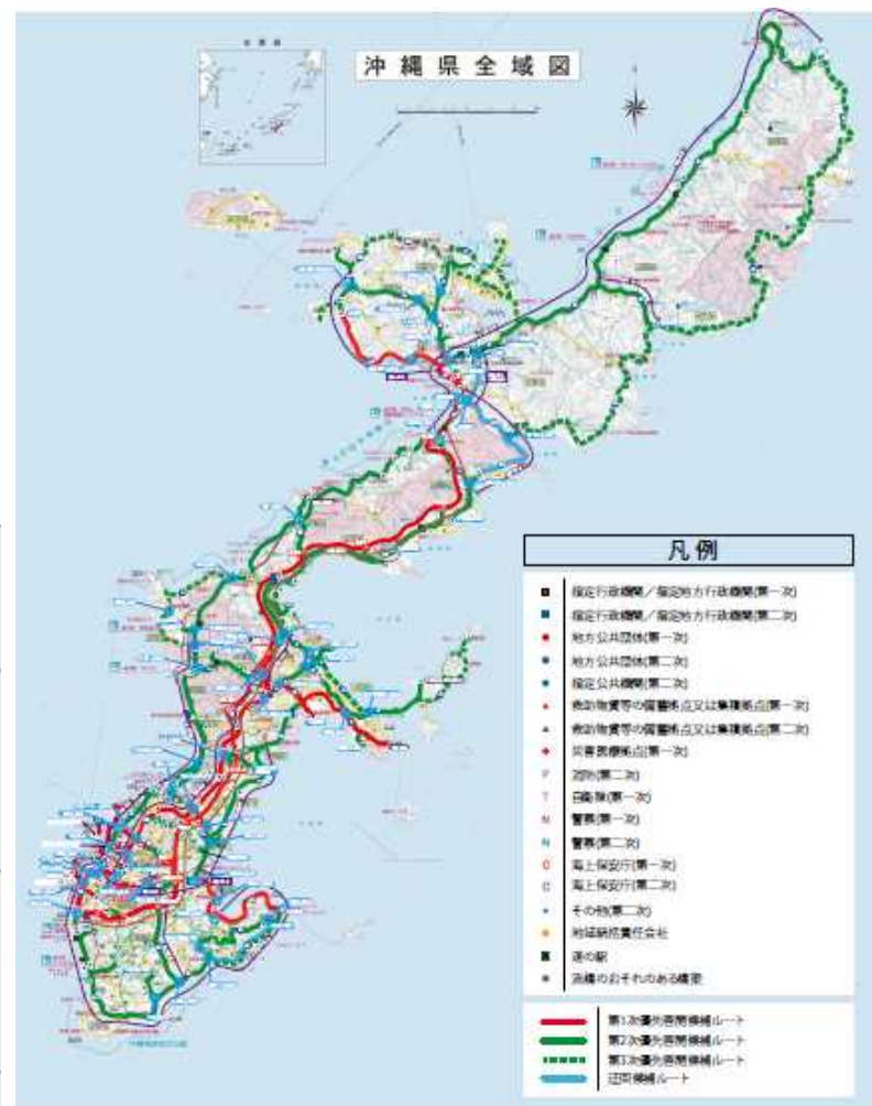
図 啓開候補ルート図(案)