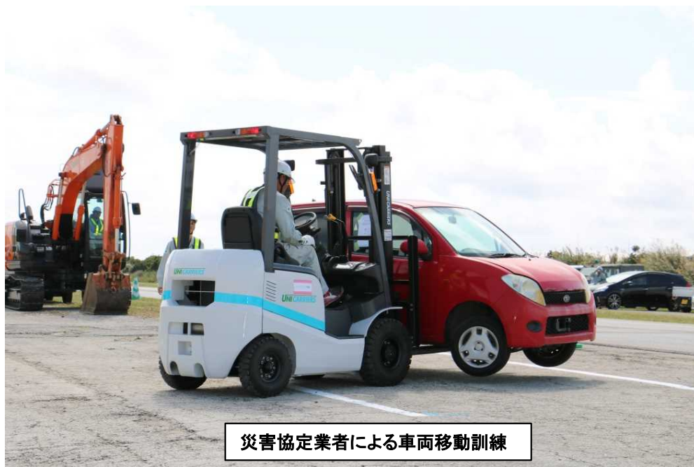
災害協定業者による車両移動訓練