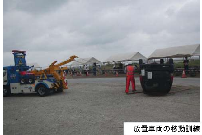
放置車両の移動訓練