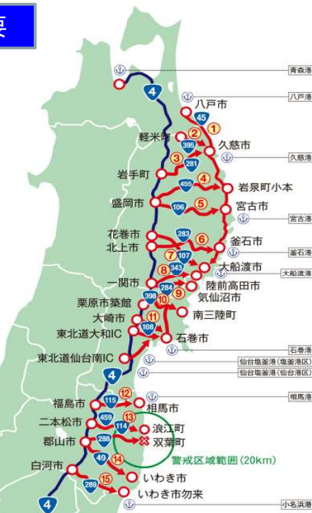
図 くしの歯作戦での啓開ルート図