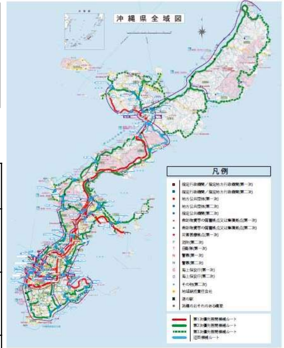
図 啓開候補ルート図(案)