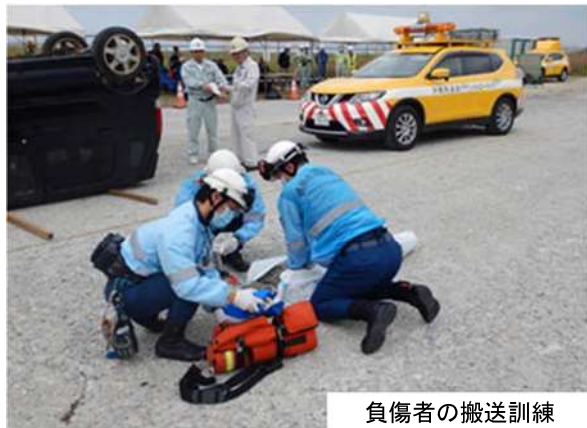
負傷者の搬送訓練