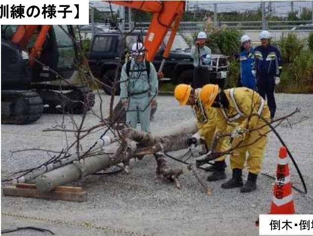
倒木・倒壊電柱の移動訓練