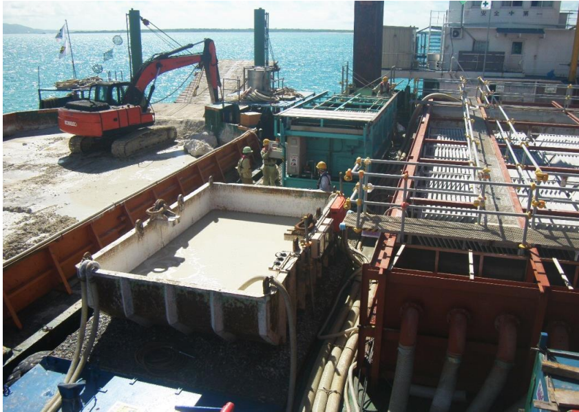
濁水濾過処理状況