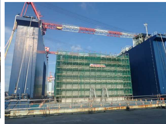
5層めの足場組立状況

コンクリートが固まり、周りの足場を片づけた後は、ケーソンをFD船から降ろします。 その作業状況は、次回以降につづく・・・。