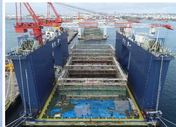
2層めの足場組立状況