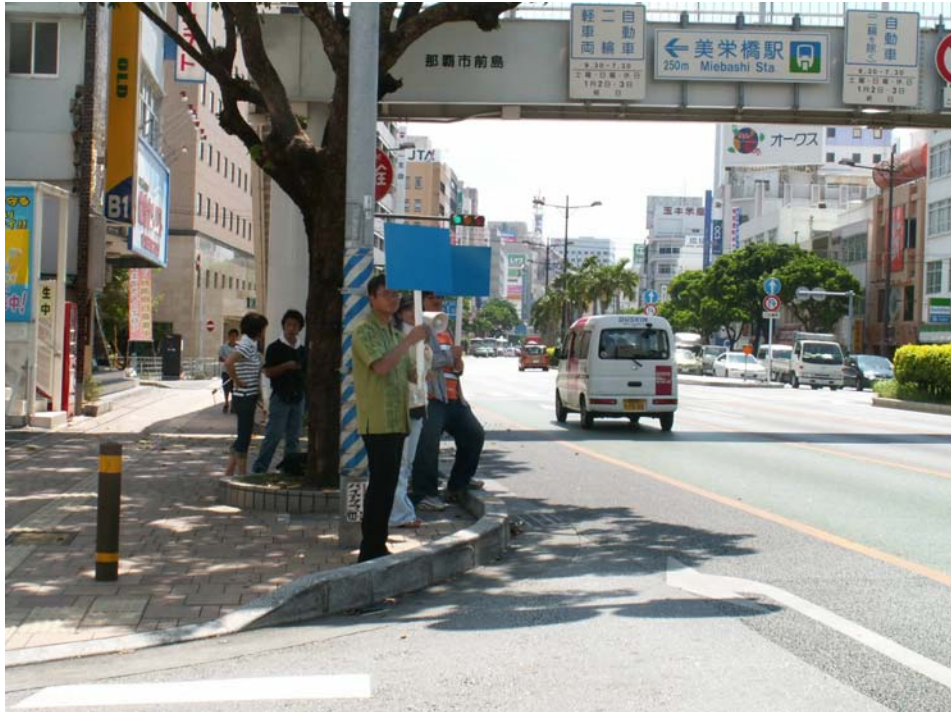
上図 : エコドライブ・キャンペーンのイメージ図