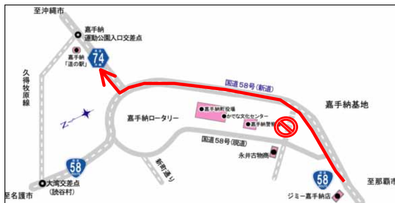
図 - 4