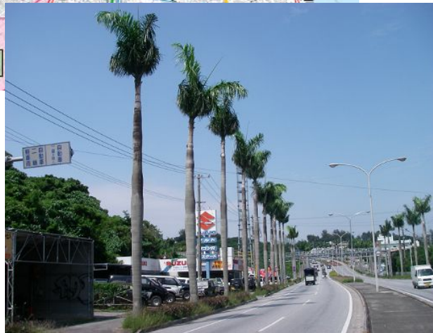
ネット施工予定区間