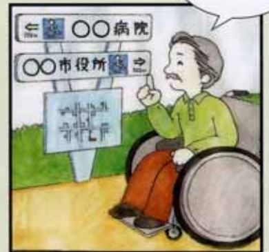
〈バリアフリー化後〉

交差点などに行き先表示や周辺地図などの歩行者案内標識を設置して、歩行者等の移動に役立つようにします。