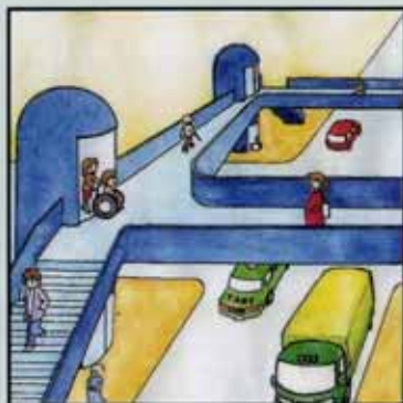
〈バリアフリー化後〉