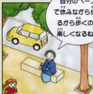
〈バリアフリー化後〉

幅の広い歩道では植樹帯・並木・柵や、休みながら歩ける施設などを整備して、歩道を快適に移動できるようにします。