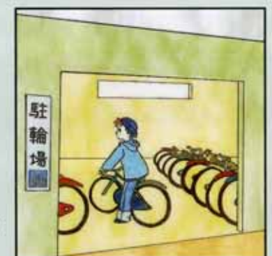
〈バリアフリー化後〉

商店街などでは駐輪場を整備することで歩道に放置される自転車をなくし、歩きやすくします。