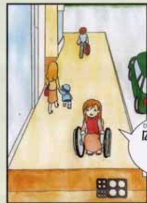
〈バリアフリー化後〉