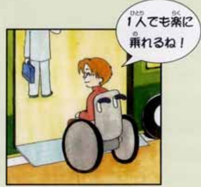
〈バリアフリー化後〉