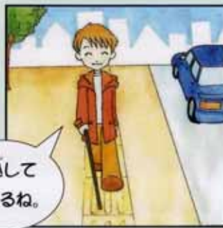
〈バリアフリー化後〉