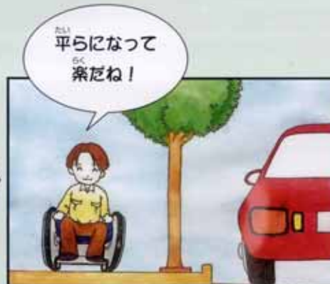
〈バリアフリー化後〉