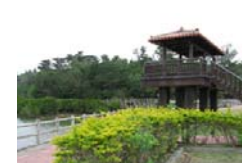
■ 東村ふれあいヒルギ公園