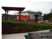
■ ヤンバルクイナ観察小屋