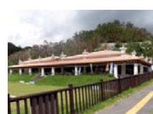
■ わんさか大浦パーク