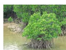
■ 慶佐次のヒルギ林