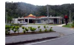
■ 東村立山と水の生活博物館