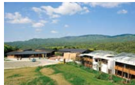
■ やんばる学びの森