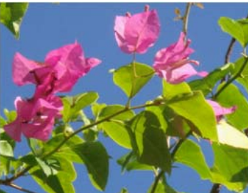
ブーゲンビリア (10~5月)