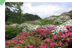
■ 東村民の森つつじエコパーク