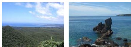
■ やんばるの山々 ■ エメラルドグリーンの海

名護市仲尾次から国頭村奥へつながる国道58号・本島北部東海岸の県道70号線及び国道331号を中心としたエリアには、地域固有の歴史的・文化的資源が点在するとともに、やんばるの森を背景に地域固有の自然資源・海岸景観に恵まれた地域です。やんばる風景花街道では、こうした地域の魅力に磨きをかけ、通過するための「みち」ではなく、「沖縄の花と美」が体感できる新しい観光街道(みち)の創出をめざし、観光振興と地域活性化を図ります。