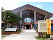
■ 道の駅ゆいゆい国頭