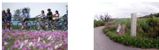
■ 亜熱帯の花々の咲く沿道 ■ 宇佐浜遺跡