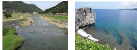
■ 奥やんばるの里 ■ 辺戸岬