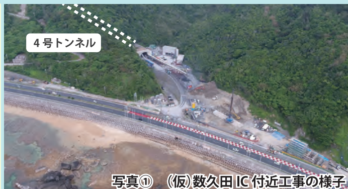
写真① (仮)数久田IC付近工事の様子