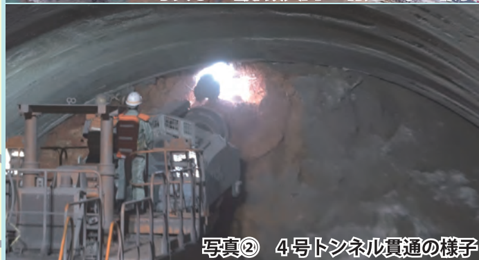
写真② 4号トンネル貫通の様子