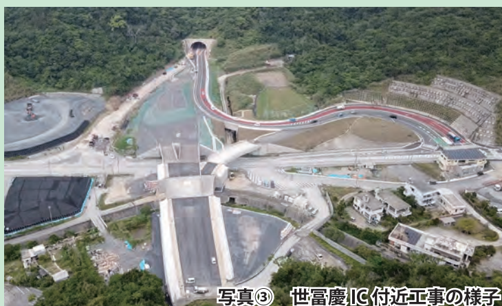
写真③ 世富慶IC付近工事の様子

hokkokumerumaga910@ogb.cao.go.jp ほっこくめるまが