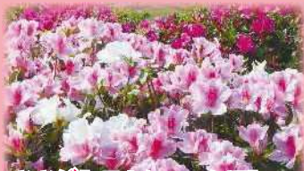
ツツジ【3月上旬～下旬頃】