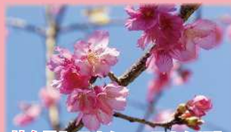
サクラ【1月中旬～2月上旬頃】