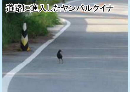
道路に進入したヤンバルクイナ