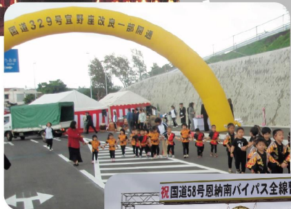
宜野座改良一部開通(平成21年)