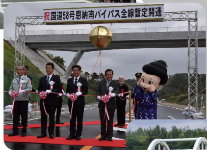
恩納南バイパス全線暫定開通(平成30年)