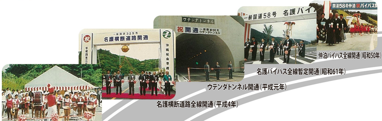
名護横断道路全線開通(平成4年)