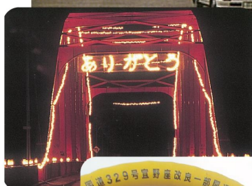
旧塩屋大橋「撤去式」(平成11年)