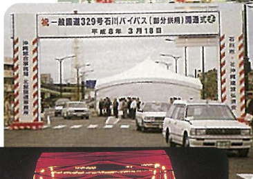
石川バイパス一部開通(平成8年)