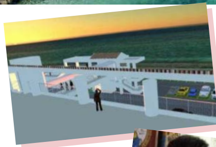
展望テラスから 夕日の眺望 (イメージ)(※1)