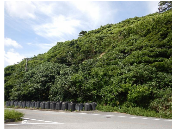
終点部 工事状況写真