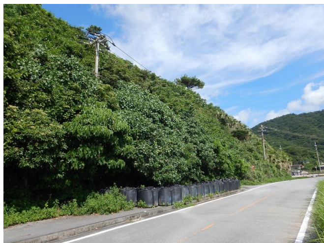
起点部 工事状況写真

復旧工施工状況写真 令和7年7月3日 工事進捗率:0% 主な作業:応急対策工維持管理