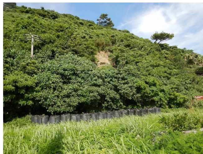
正面部 工事状況写真