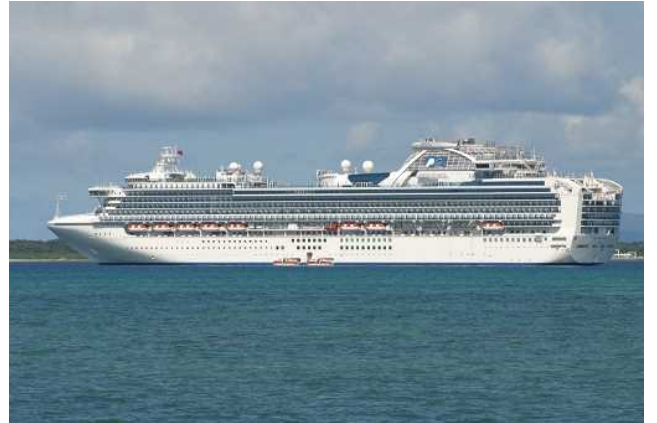
5月24日 石垣へ寄港したサファイア・プリンセス