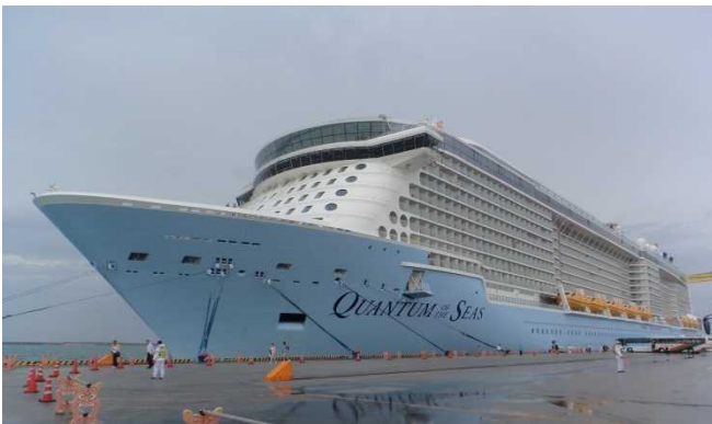
昨年、那覇港へ寄港したクァンタム・オブ・ザ・シーズ

クァンタム・オブ・ザ・シーズはアジア最大級の船舶であり、多くの乗客の来訪が見込まれます。