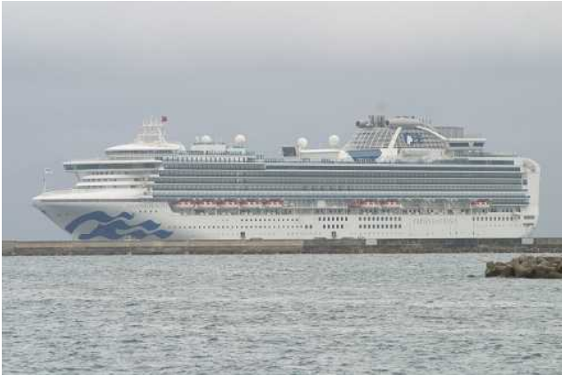
5月16日 石垣へ寄港したダイヤモンド・プリンセス

5月16日、プリンセス・クルーズ社の大型客船、ダイヤモンド・プリンセス（115,906トン）が、石垣港へ初寄港しました。また、23日には、サファイア・プリンセス（115,875トン）が平良港、24日には石垣港など、5月は初寄港が相次ぎ、多くの乗客が宮古島、石垣島を訪れました。