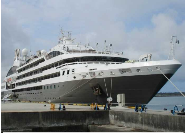
6月6日 平良港に初寄港したロストラル

また、9日には、大型クルーズ船のスカイシー・ゴールデン・エラ（72,458トン）が、平良港へ初寄港しました。