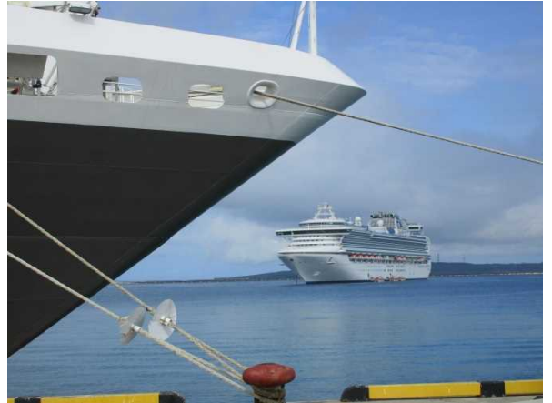
6月6日 平良港に寄港したサファイア・プリンセス