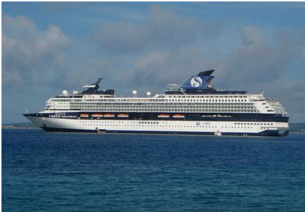
6月9日 平良港に初寄港したスカイシー・ゴールデン・エラ