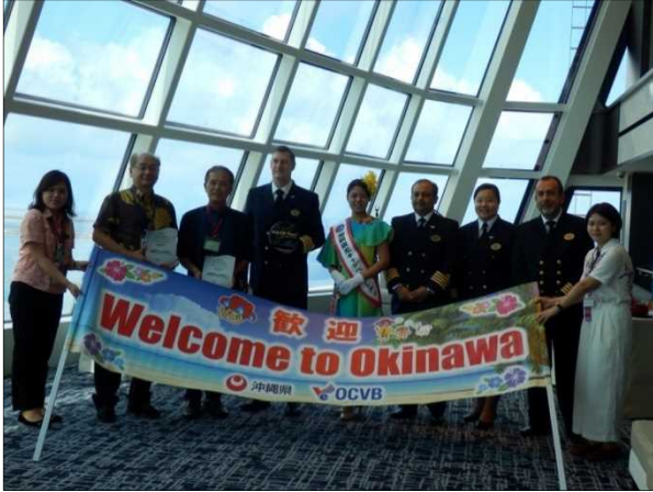
8/16 船内での歓迎セレモニーの様子