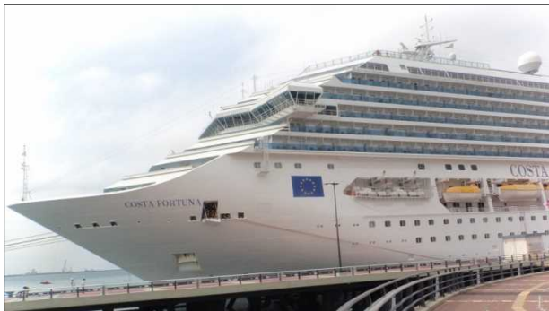
那覇港へ寄港したコスタ・フォーチュナ

・10月24日、コスタ・クルーズ社の大型客船、コスタ・フォーチュナ（102,587トン）が石垣港へ初寄港する予定です。