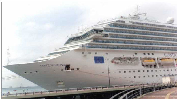
那覇港へ寄港したコスタ・フォーチュナ