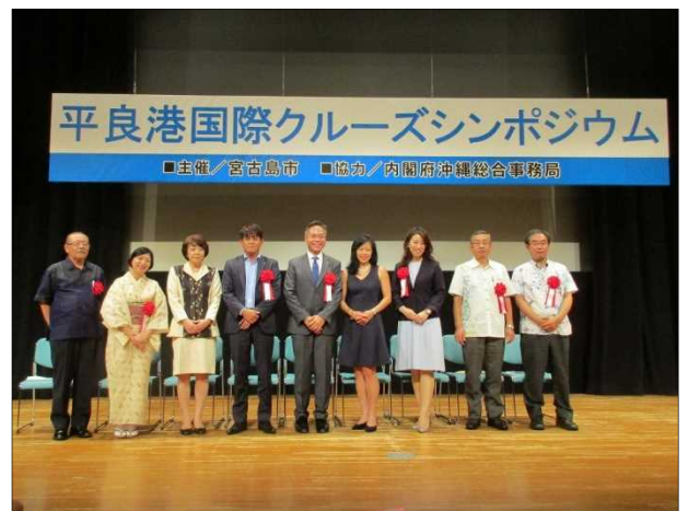
シンポジウム参加の記念撮影