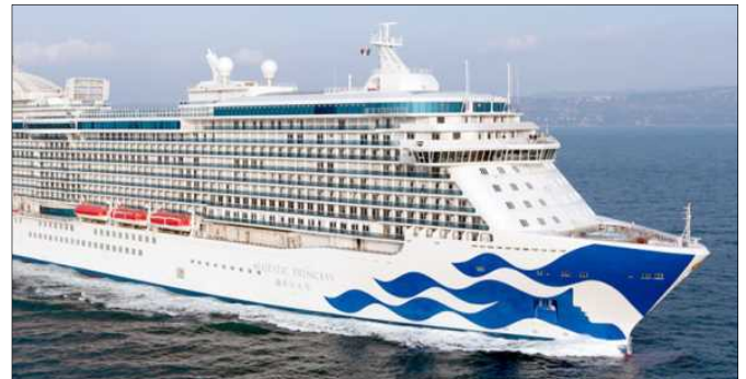
マジェスティック・プリンセス