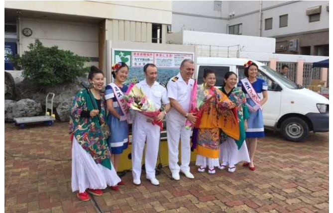
平良港への初寄港時における 歓迎セレモニーの様子（11月14日）