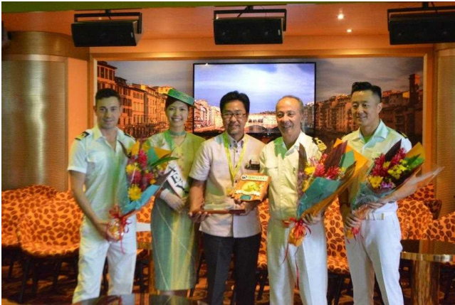
石垣港への初寄港時における 船内での歓迎セレモニーの様子（10月24日）

また、11月14日には、同船が平良港へ初寄港し、平良港マリンターミナルビル前で歓迎セレモニーが行われました。