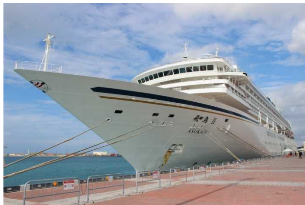
那覇港に寄港する飛鳥Ⅱ（2014年11月30日）

・邦船社の飛鳥Ⅱ（50,142トン）が、11月28日から神戸港発着の「南西諸島・台湾クルーズ」ツアーを行う予定となっております。同ツアーには、那覇（11/30）座間味（12/1）石垣（12/3）への寄港が含まれております。