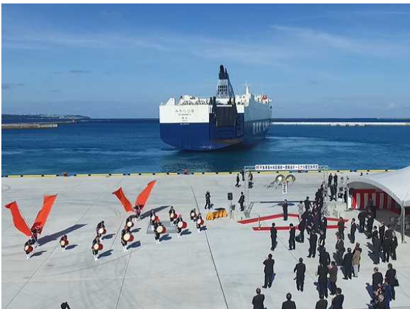
「琉球國祭り太鼓」による演舞