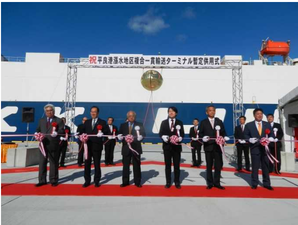
関係者によるテープカットの様子

式典では、主催者の下地敏彦宮古島市長及び能登靖沖繩総合事務局長による式辞が述べられ、山下内閣府沖繩担当大臣政務官、高橋国土交通大臣政務官、島尻内閣府大臣補佐官、地元選出の国会議員、宮古島市議会議長、伊良皆多良間村長、港湾関係者等によるテープカット・くす玉開披が行われ、新しい岸壁の供用開始を祝いました。