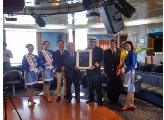
1月2日 船内での歓迎セレモニーの様子