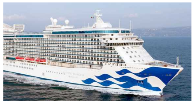
マジェスティック・プリンセス

※2017年の訪日クルーズ旅客数とクルーズ船の寄港回数（速報値）【国土交通省プレス資料】 http://www.mlit.go.jp/report/press/port04_hh_000189.html