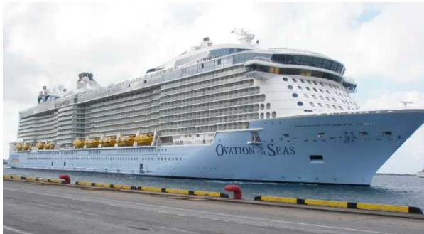
那覇港に寄港したオベーション・オブ・ザ・シーズ