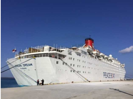
1月2日 平良港に初寄港したオーシャン・ドリーム