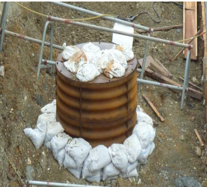
小型ライナープレート設置状況

※平成28年度 沖縄総合事務局ライナープレート保有数 大型ライナープレート13基、中型ライナープレート14基、小型ライナープレート19基。