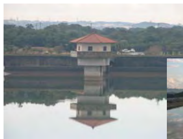
鏡の取水塔↑と、鏡の空→