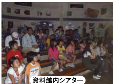
資料館内シアター