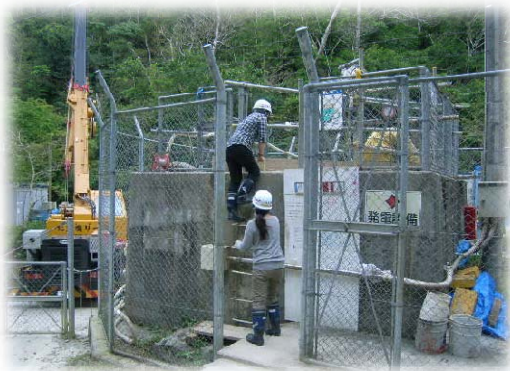
陸地側のトンネル入口から入る