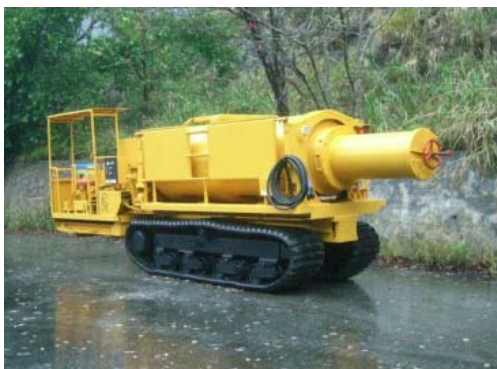
トンネル内をコンクリートを運搬する建設機械(アジテータ車)