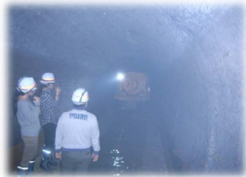
トンネル内で建設機械と遭遇