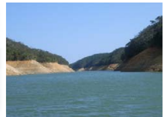
貯水位が低いため、断念！