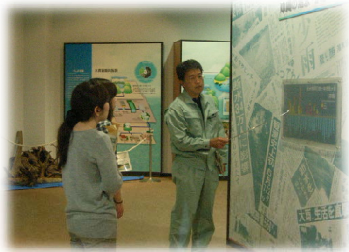
ダム資料館で説明