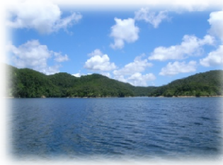
こういう風景を見ながら現場へ行く予定でしたが...