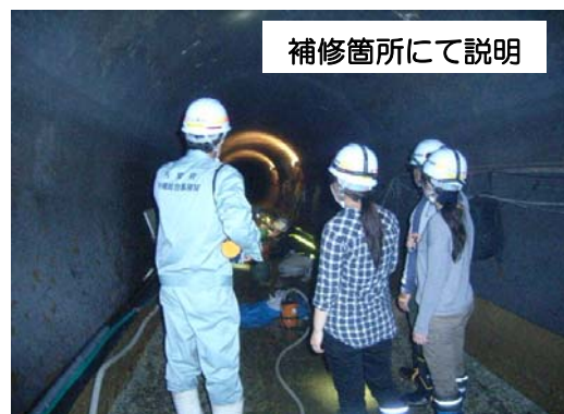
補修箇所にて説明