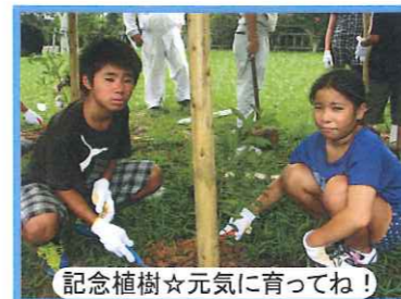
記念植樹☆元気に育ってね!