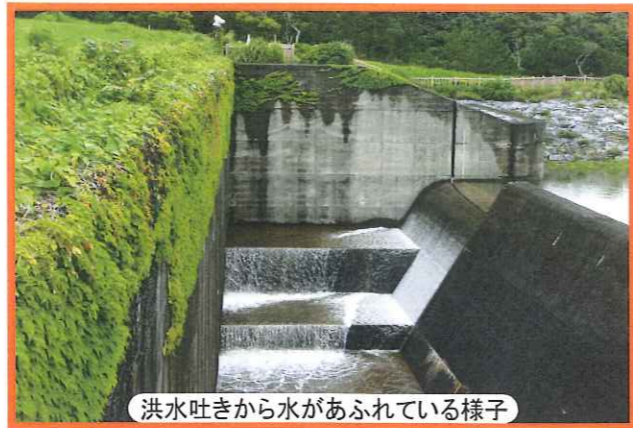
洪水吐きから水があふれている様子