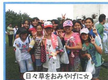
日々草をおみやげに☆