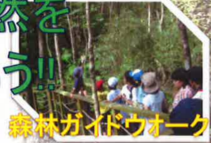
森林ガイドウォーク