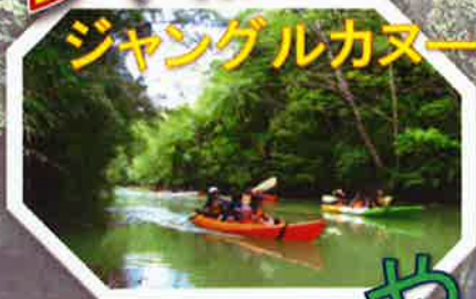
ジャングルカヌー