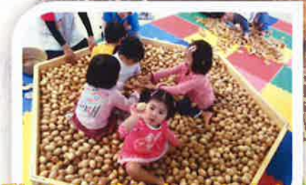
移動やんばる森のおもちゃ

【無料・先着順】※当日受付で9:00～のほか、時間帯で数回に分け受付 → 定員に達し次第終了 安波ダム湖面遊覧・32回予定(10:20～16:40 1回大人4名程度) 安波ダム施設見学・10回予定(10:20～16:00 1回大人6名程度) 丸太切り体験・森林クイズ【10:00～15:00】