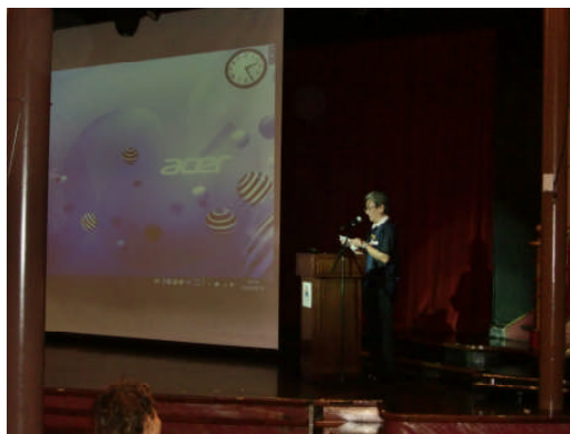
【オリエンテーション】