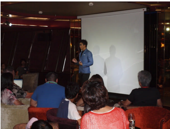
○マジックショー（マレーシア？の人）