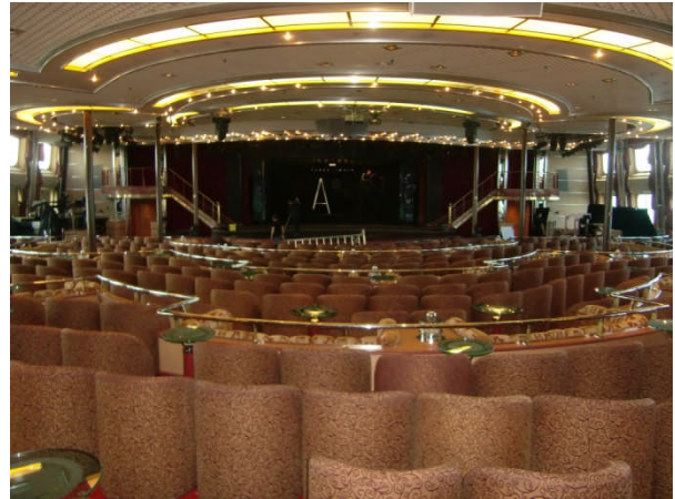
○見学状況（ショーラウンジ）