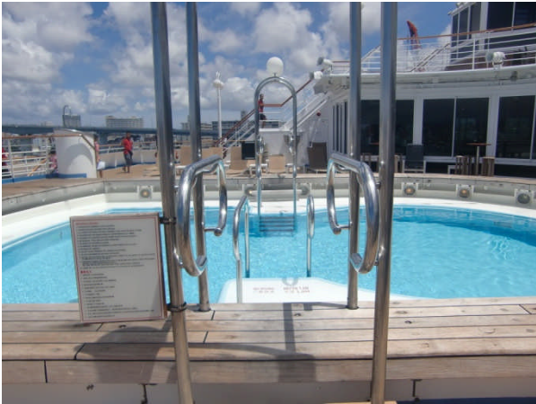
○見学状況（屋外プール）