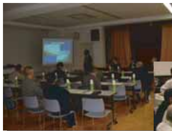
※ワークショップ 実施イメージ