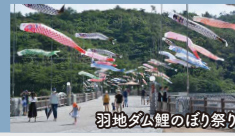
羽地ダム鯉のぼり祭り