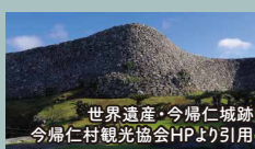
世界遺産・今帰仁城跡