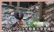
ヤンバルクイナ生態展示学習施設